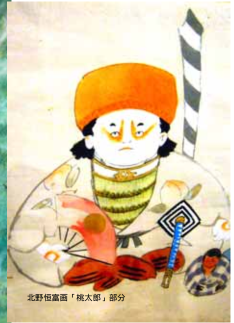
北野恒富画「桃太郎」部分